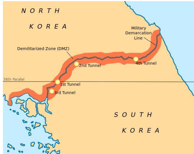
The Korean DMZ is shown in red with the Military Demarcation Line (MDL) denoted by the black line

韩大使说：“韩国由一个必须依靠救济的国家发展到今天足以证明韩国政府的领导和政策行之有效。韩国推行发展的新村运动取得了政治和经济上的巨大成功。我们愿意把这种经验由亚洲地区向全球分享出去。”