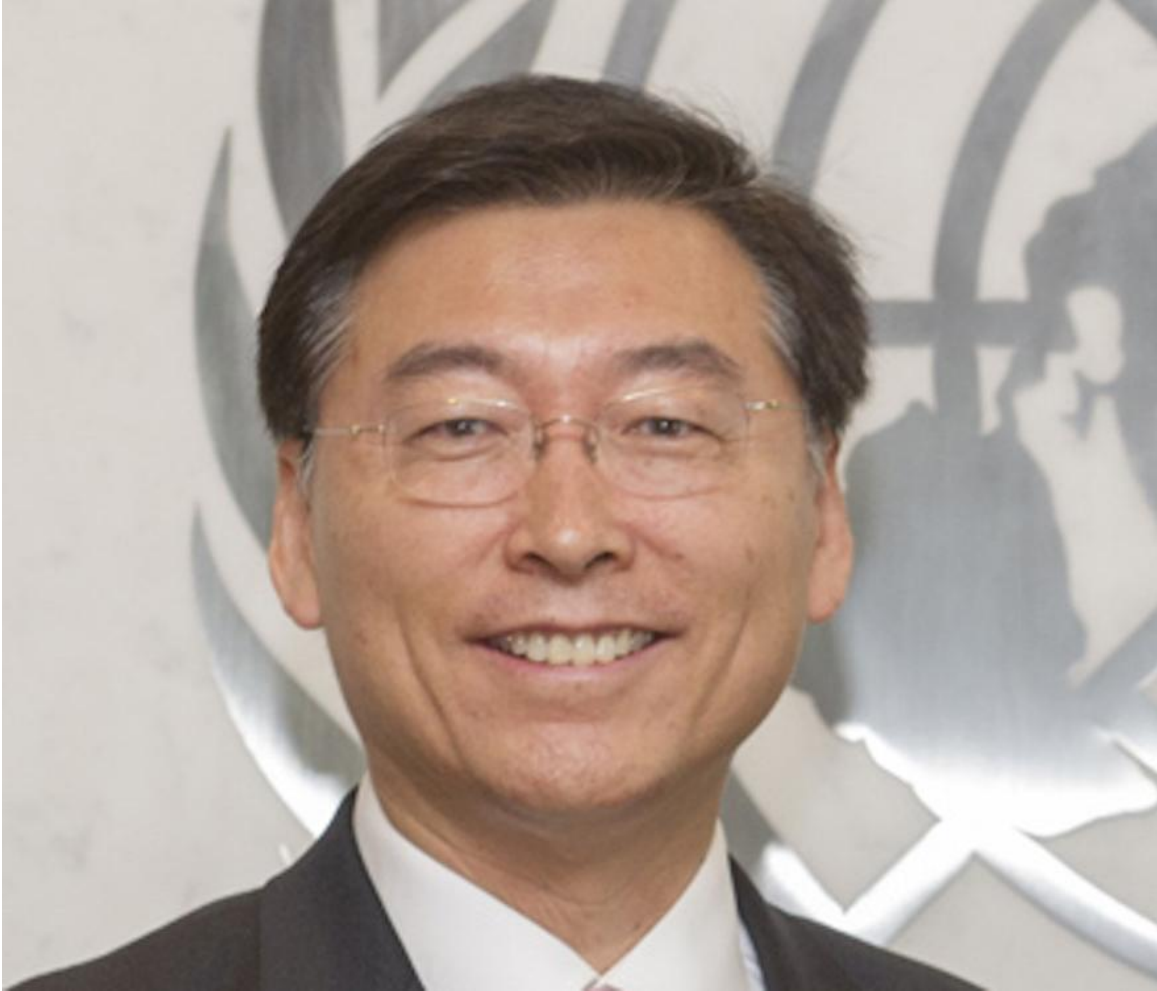
Ambassador Hahn Choong-hee, Deputy Permanent Representative of the Republic of Korea to the United Nations in New York