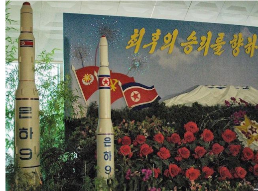
Model of a Unha-9 rocket on display at a floral exhibition in Pyongyang, 30 August 2013

韩国代表团联合国常驻副代表韩忠熙大使在接受 INPS 的采访时说道：“我们不能只是纸上谈兵，朝鲜的做法违反了联合国安理会的朝鲜决议，是对我们赤裸裸的蔑视和嘲笑。我们必须对此野蛮行径做出相应的回应。”